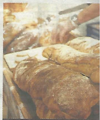
Surdegsbrödet skars upp i skivor.